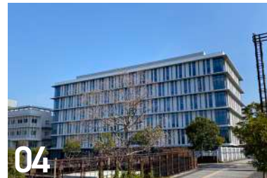
04 クレインハーバー長崎ビル 出島町 1-41