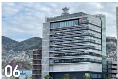
06 NBC長崎放送本社ビル 尾上町 5-6