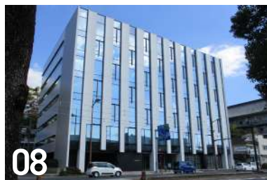
08 長崎駅前電気ビル 御船蔵町 2-3