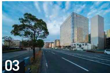
03 NAGASAKI BizPORT 元船町 9-18