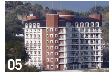
05 モン・サン琴海村松 琴海村松町 399