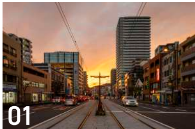
01 新大工町ファンスクエア 新大工町 5-35