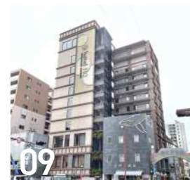
09 ホテルH2 築町 5-11