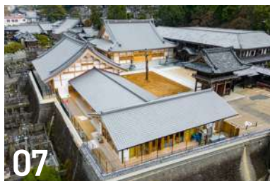
07 皓台寺 伽藍再建 寺町 1-1