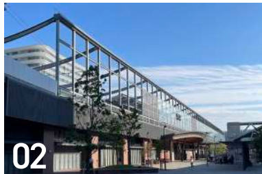
02 JR長崎駅 尾上町 1-60